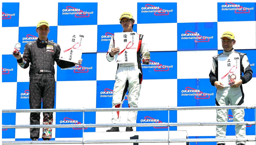
FJ マスターズ(ジェントルマン)の表彰。

FJ マスターズシリーズは、全国戦のFJ ジャパンリーグに参加されているジェントルマン選手(40 才以上)を対象にシリーズ化されたもので、毎レース、ポイントと賞金が与えられる。また、ポイント集計によりシリーズ賞/賞金が設定されている。